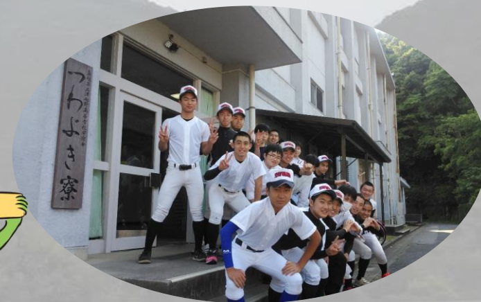
放課後部活に行く前、男子寮前にて