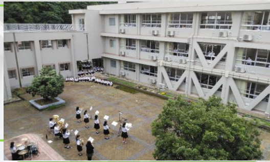
吹奏楽部・最後の演奏会の様子